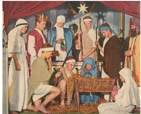
Krybbeespil i Hellebæk kirke