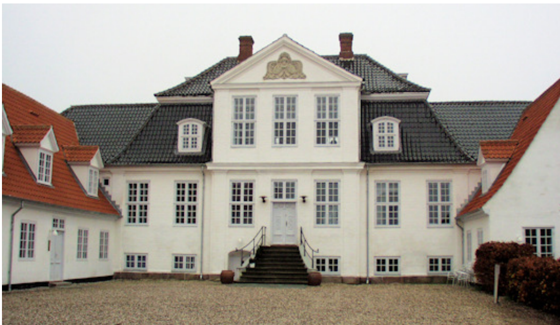
Det kongelige Opfostringshus

"Paradisets Have" er skrevet i 2003 til et jubilæumsskrift i anledning af 250-året for grundlæggelsen af Det kongelige Opfostringshus. Skolen blev lukket få år senere.